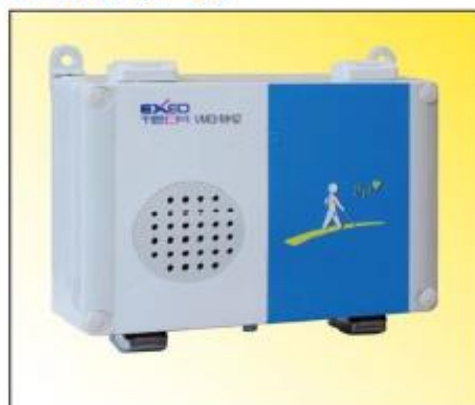
小型送受信機シグナルエイト