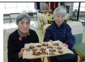
お菓子作りをしました