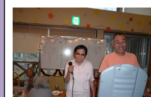
カラオケは盛り上がります