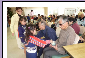
園児さんと交流します