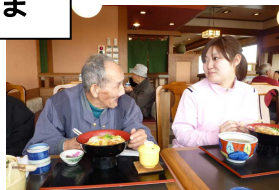
誕生会は外食です