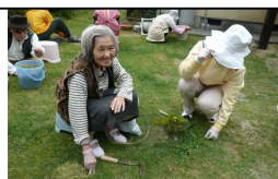
草取りのお手伝い御苦労さま

入所者の皆さん生活の一部を紹介します。 ひまわりのような、笑顔がいっぱいです！！